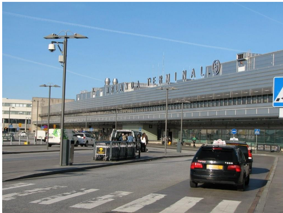
Gráfica 2: Aeropuerto de Arlanda